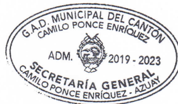
SECRETARIA CONSEJO DE PLANIFICACIÓN